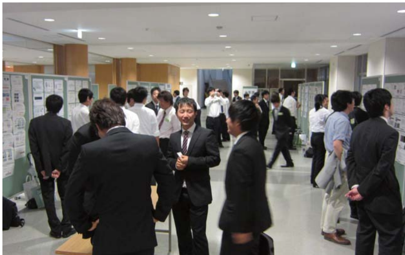
図 1 ポスターセッション会場 (発表件数: 40 件, 参加者: 約 80 名)

また, 自分の研究分野とは違う分野のポスターの前で熟読する姿や, 他大学の学生・若手教員や外国人研究者との交流を深め, 熱心にディスカッションされる姿が見られました (図 2, 図 3 参照)。特に, 学生が外国の研