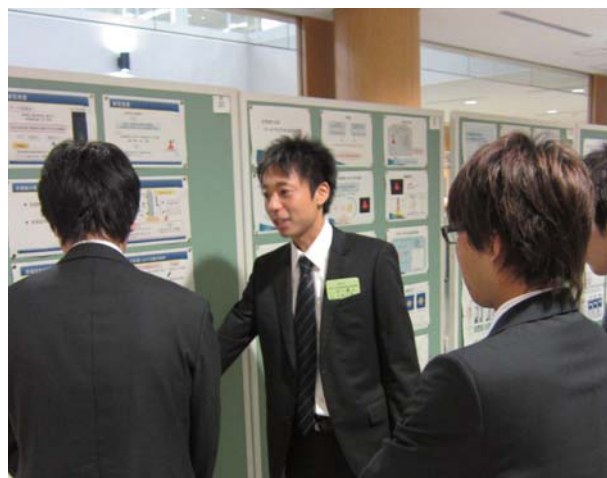
図3 質疑応答中のパネラー