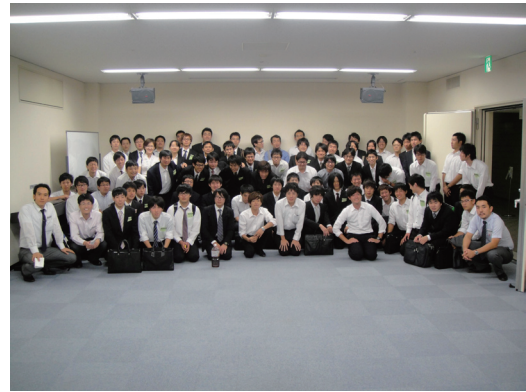
図3 集合写真（イブニングフォーラム終了後）

幕を閉じました。今回のイブニングフォーラムでは、若手研究者の交流の場および若手の研究活動啓発の場として今後の活性化が期待される印象を受けました。イブニングフォーラム終了後、全員で集合写真を撮り、閉会いたしました（図3 集合写真）。